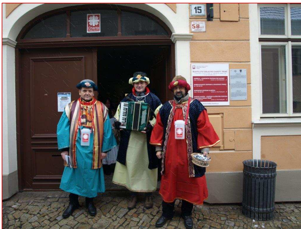
Naši koledníci v nových kostýmech

V letošním roce jsme měli pozitivní ohlas na koledníky, kteří byli oblečeni v kostýmech. Tyto kostýmy si koledníci většinou obstarávali sami nebo nás prosili o zapůjčení. Na letošní rok naše dlouholetá dobrovolnice ušila plno krásných nových kostýmů, poptávka však byla vyšší. Proto jsme nelenili a začali se sháněním metrového textilu. Od jedné firmy se nám podařilo získat větší množství látek, které budou k dispozici pro Vás všechny, kteří byste chtěli pro své koledničky v obci zhotovit tříkrálové kostýmy. Látky si lze vyzvednout v Dobrovolnickém centru v Oblastní charitě Třebíč, L. Pokorného 15 – Židovská čtvrť. Hledáme také šikovné švadlenky, které by byly ochotny ušít kostýmy pro třebíčské koledníky. Veřejnost koledníky v kostýmech vítá s laskavým přístupem, proto Vás prosím o pomoc.