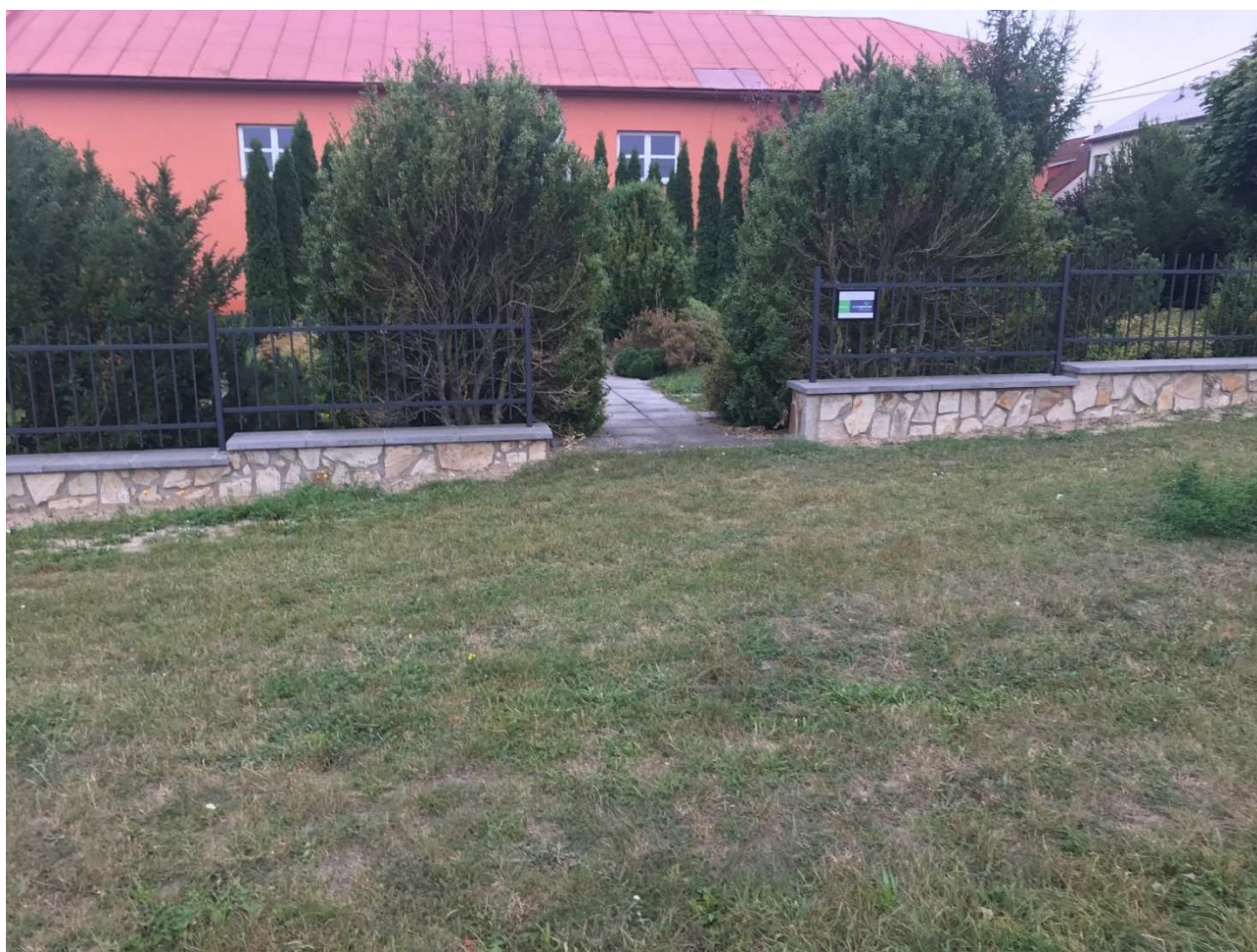
Pohled na nové oplocení

Nejvýznamnější akcí byla realizace stavby víceúčelové budovy . Jedná se o nejdražší stavbu, která byla dosud v obci realizována. Smlouva o dílo byla sepsána se zhotovitelem firmou MS STAVMONT s.r.o., se sídlem Jindřichův Hradec III, IČ: 28160240, stavba byla zahájena v únoru 2023, po stavební stránce byla dokončena v prosinci 2023, avšak reklamace subdodávek a administrativa pokračovaly v roce 2024. Do majetku obce bude zapsána po vydání kolaudačního souhlasu v roce 2024. Hodnota této nedokončené investice činila k 31.12. částku 13.316.719,97 Kč.