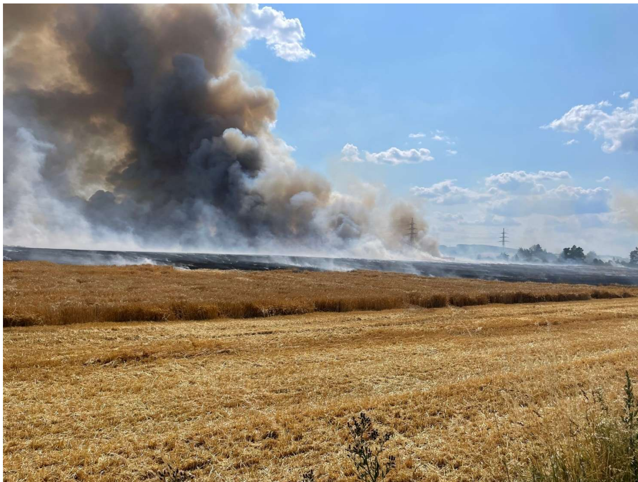
Fotografie z požáru pole dne 9. 7. 2023 – vlastní fotografie.

Jestliže v létě bylo deště málo, rychlé tání sněhové nadílky 25. prosince způsobilo záplavy, a to na několika místech ČR. Mnozí vlastníci nemovitostí tak neprožili klidné sváteční dny. V naší obci se množství vody valící se řekou a vylévající se z koryt do okolí a ohrožující blízké nemovitosti týkalo samot - tzv. Rezkova mlýna č.p. 35 a okolních č.p. 87, č.p. 141, kde zasahovala jednotka profesionálních hasičů, která pomohla s ochranou majetku. Z důvodu zaplavení území a neprůjezdnosti silnic byl dočasně odříznut přístup i do Červeného mlýna č.p. 36.