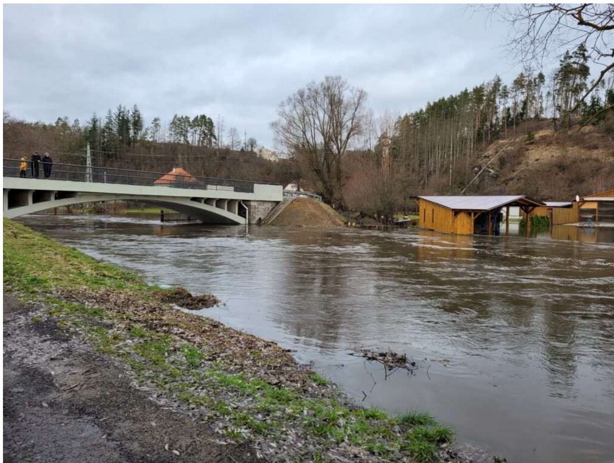
Fotografie – viz text.