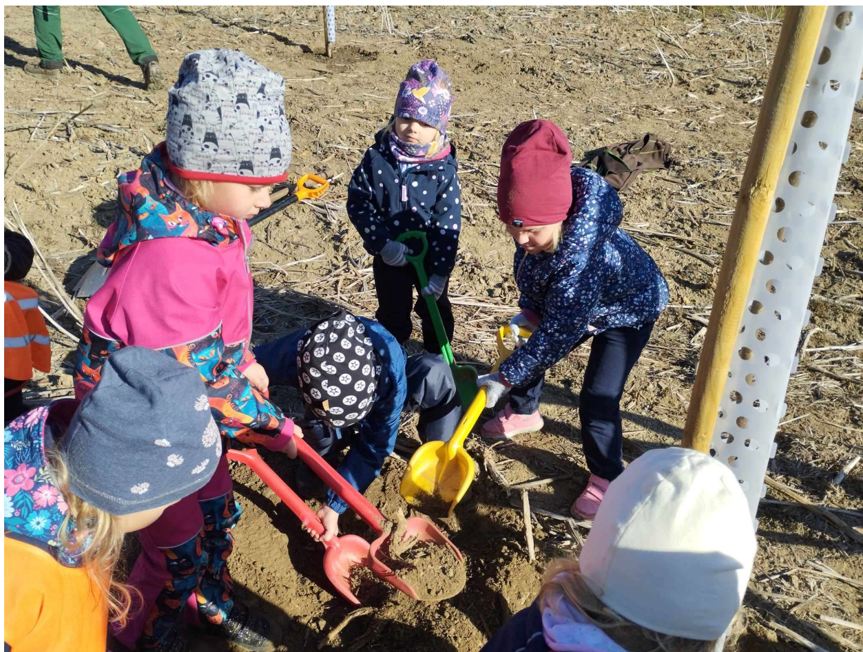
Pomoc dětí při výsadbě obnovy sadu

Stromky dodala a odborně vysázela zahradní firma Renata Křížová, Trnava, které s výsadbou vydatně pomáhaly děti z mateřské školy.